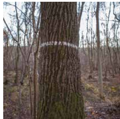
1 er COLONNE DE HAUT EN BAS: © DITA PEPE, © ADRIEN BRUNEL, © ARNAUD LERÉDE, © TORSTEN SCHUMANN, © NASTASSJA ET MARIO GUAY, © DIDIER GUALENI, © HUGUES ALLART.